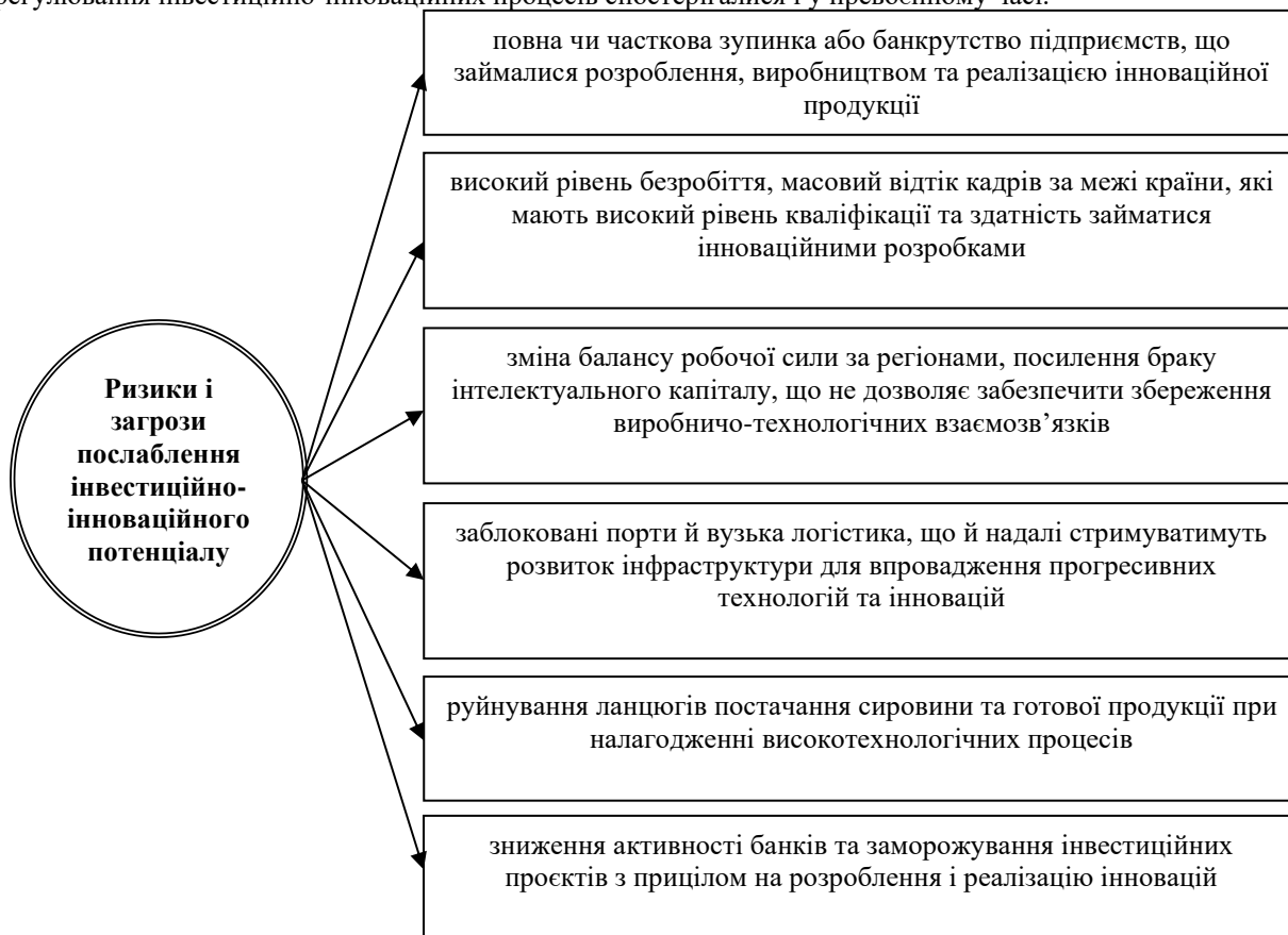
Рис. 1. Сукупність ризиків і загроз послаблення інвестиційно-інноваційного потенціалу в системі економічної безпеки України в умовах повномасштабної війни

Відмітимо, що із початку повномасштабної війни суттєво порушено систему стратегічного планування, в контексті якої здійснювалось проєктування інвестиційних програм інноваційного спрямування. Хоча війна і стала каталізатором значних негативних змін, але проблеми у секторі державного регулювання інвестиційно-інноваційних процесів спостерігалися і у превоєнному часі.