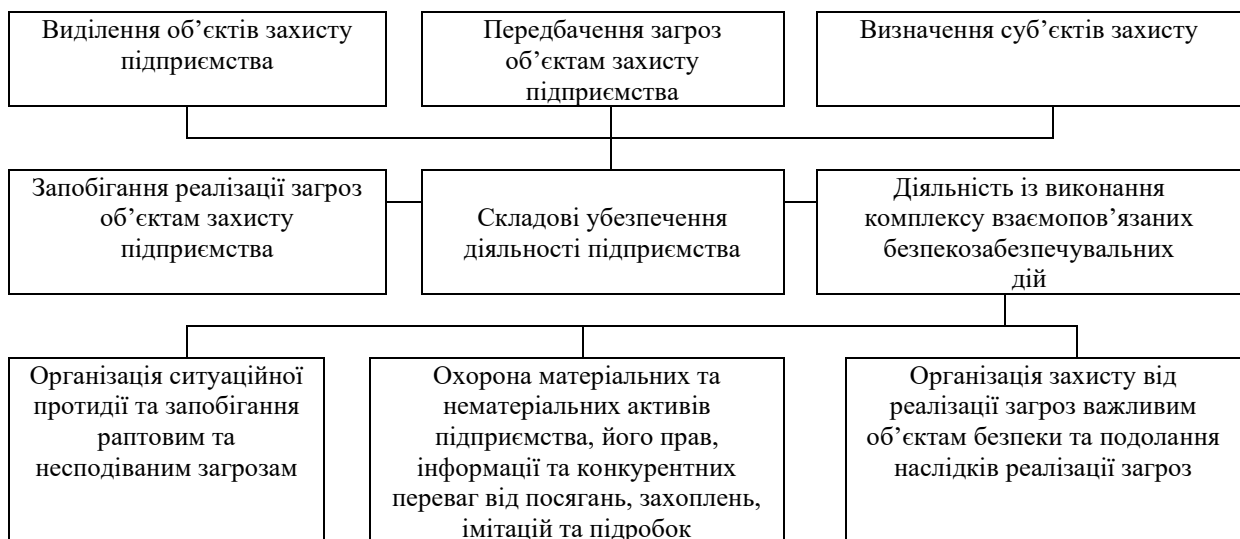
Рис. 1. Складові забезпечення діяльності підприємства

Забезпеченню діяльності підприємства як процесу, перебіг якого охоплює усі функціональні види діяльності підприємства та діяльність усіх його структурних підрозділів, притаманна комплексність. Складові забезпечення діяльності підприємства як комплексного процесу надано на рис. 1.