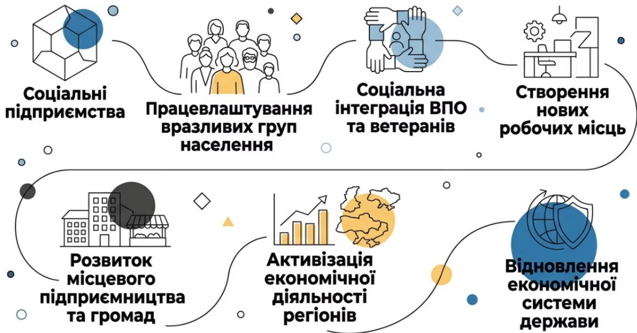
Рис. 2. Вплив соціального підприємництва на процеси післявоєнного відновлення економіки