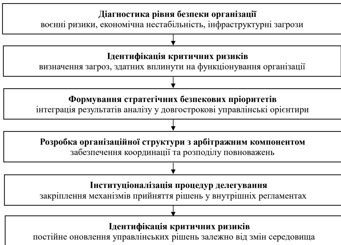
Рис. 3. Алгоритм впровадження безпекоорієнтованого управління в організації (розроблено автором)

Структурно алгоритм включає такі етапи (рис. 3).