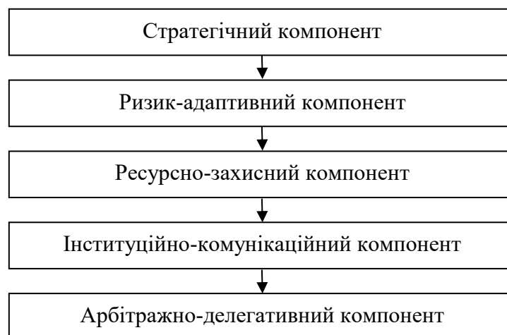
Рис. 1. Комплексний підхід до формування безпекоорієнтованого управління організацією (розроблено автором)

Запропонований комплексний підхід до формування безпекоорієнтованого управління організацією включає п'ять взаємопов'язаних компонентів (рис. 1).