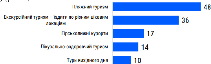
Рис. 2. Види відпочинку, яким надавали перевагу в Україні у 2021 р.

Тут слід відзначити суттєву зміну пріоритетів за цей період, адже за результатами опитування «Дослідження внутрішнього та виїзного туризму українців», проведеного компанією «Хьюман Ресерч» на замовлення Державного агентства розвитку туризму у 2021 р. пріоритетним видом туризму був саме пляжний туризм (близько 48 %) (рис. 2).