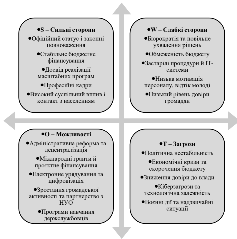
Рис. 2. SWOT-матриця внутрішнього середовища організацій публічної сфери