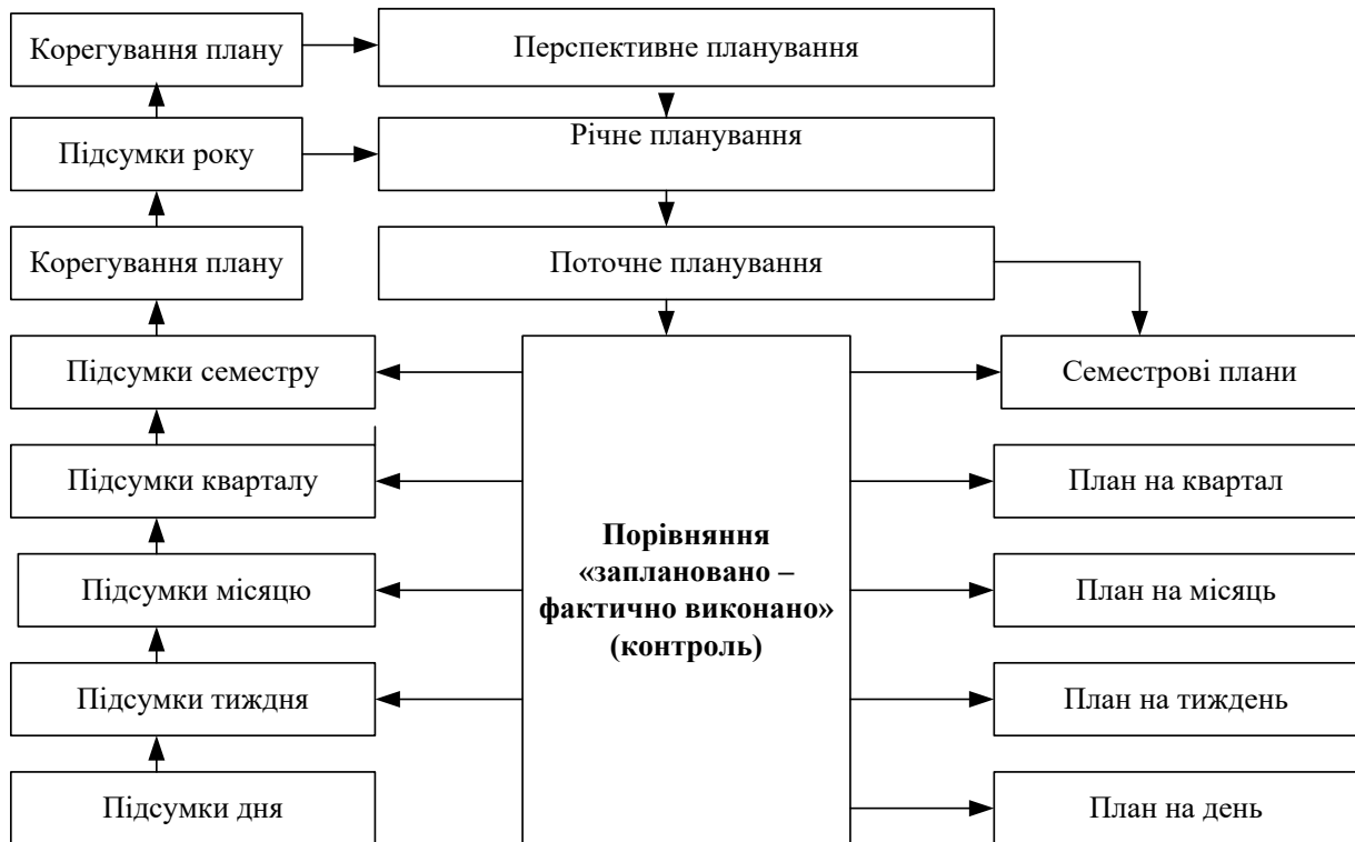
Рис. 3. Система планування роботи керівника закладу освіти

Отже, для удосконалення самоменеджменту керівників закладів освіти доцільно впроваджувати тренінгові програми, менторство, супервізію та регулярну самооцінку, що сприятиме формуванню навичок самоуправління як елемента професійного зростання.