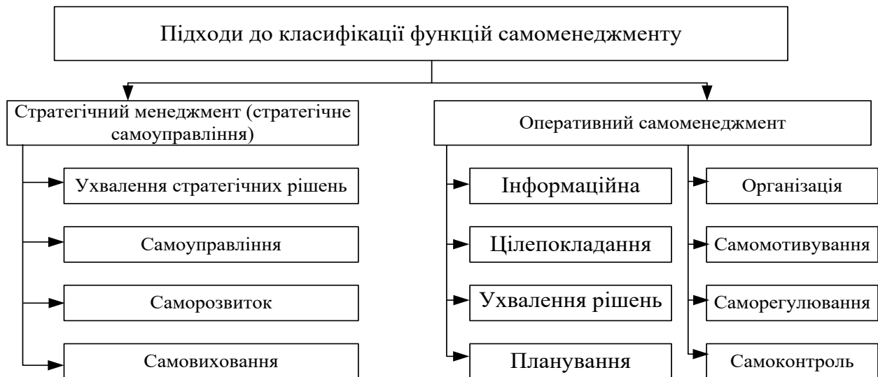
Рис.1. Класифікації функцій самоменеджменту

На рис. 1 наведено класифікацію функцій самоменеджменту.