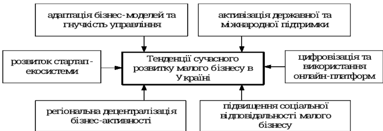
Рис.2. Актуальні тенденції розвитку малого бізнесу в Україні

Проте в умовах цих викликів поступово почали формуватися нові тенденції, які засвідчують не лише здатність малого бізнесу до трансформації, а й його важливу роль у підтримці економічної стабільності. Актуальні процеси цифровізації, зростання інноваційної активності, посилення партнерств із міжнародними структурами та активізація державної підтримки створюють основу для переосмислення підходів [8]. На рис. 2 зображено актуальні тенденції розвитку малого бізнесу в Україні, що відображають основні напрямки ведення бізнесу в сучасних реаліях.