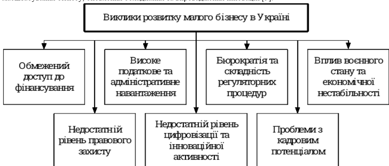
Рис.1. Виклики розширення діяльності малих підприємств на території України

Дослідження сучасних підходів до розвитку малого бізнесу, вивчення основних викликів, актуальних тенденцій і ефективних інструментів підтримки відіграє ключову роль у розробці ефективних підходів до розвитку підприємництва в Україні та сприяє стабільному економічному поступу. Передусім, сектор малого бізнесу в Україні зіштовхується з комплексом системних проблем, які суттєво впливають на його розвиток і конкурентоспроможність. Однією з найгостріших є обмежений доступ до фінансування: більшість малих підприємств мають труднощі з отриманням кредитів через високі відсоткові ставки, недостатню заставну базу та складні вимоги банківських установ. Відсутність доступних фінансових ресурсів стримує можливості для масштабування бізнесу, оновлення обладнання та впровадження інновацій [9].