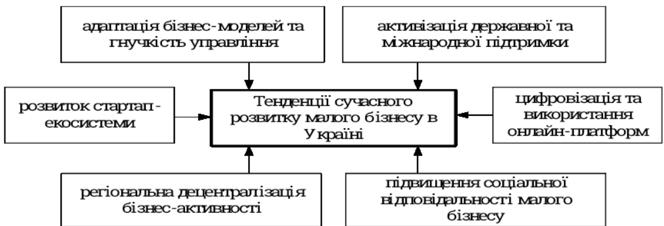
Рис.2. Актуальні тенденції розвитку малого бізнесу в Україні

Проте в умовах цих викликів поступово почали формуватися нові тенденції, які засвідчують не лише здатність малого бізнесу до трансформації, а й його важливу роль у підтримці економічної стабільності. Актуальні процеси цифровізації, зростання інноваційної активності, посилення партнерств із міжнародними структурами та активізація державної підтримки створюють основу для переосмислення підходів [8]. На рис. 2 зображено актуальні тенденції розвитку малого бізнесу в Україні, що відображають основні напрямки ведення бізнесу в сучасних реаліях.