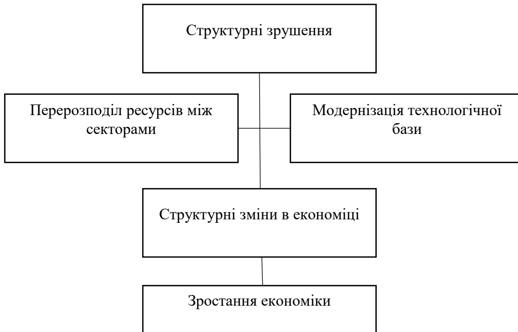
Рис. 2. Послідовність структурної трансформації