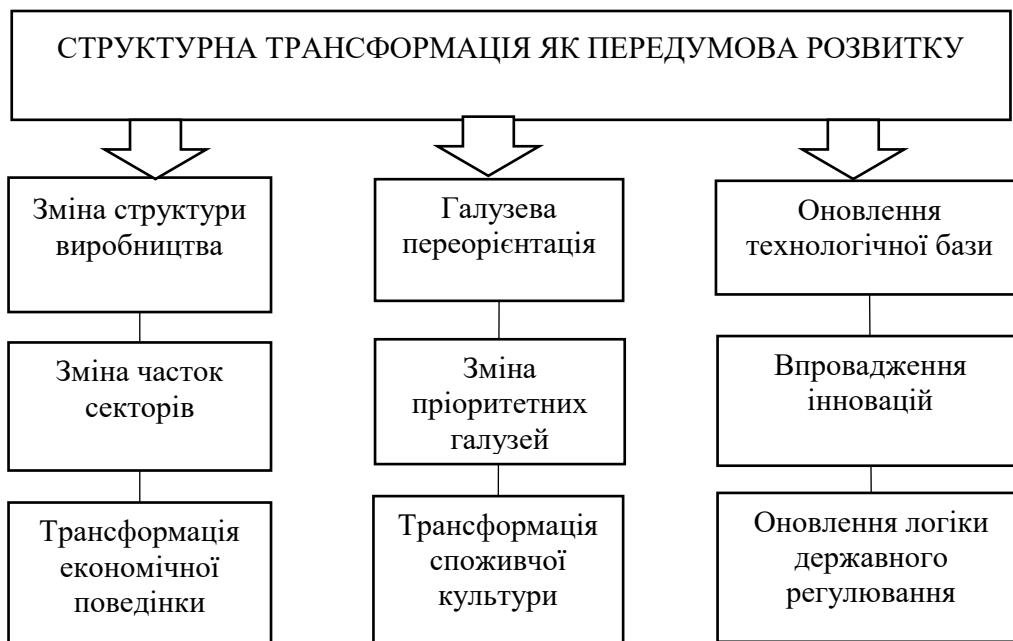
Рис. 1. Трикомпонентний підхід структурної трансформації економіки

Структурна трансформація економіки є ключовим напрямом модернізації національного господарства в умовах глобальної конкуренції та швидкої технологічної еволюції. Вона відображає глибинні зміни у співвідношенні галузей, секторальних пріоритетів, технологічного базису та інституційних форм, що забезпечують продуктивну зайнятість і економічне зростання. У сучасному розумінні структурна трансформація включає не лише галузеві зміни, а й еволюцію економічної поведінки, трансформацію споживчої культури та оновлення логіки державного регулювання. Саме трикомпонентний підхід структурної трансформації дає змогу зрозуміти єдність трьох елементів у досягненні результативності (рис. 1).