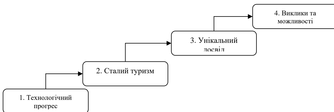
Рис. 2. Інноваційний ландшафт індустрії туризму та гостинності