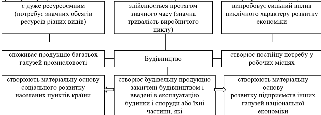
Рис. 1. Особливості будівельної галузі

Будівництву як і кожній галузі національної економіки притаманна низка властивих лише йому характерних рис, що визначають його внесок до загальнодержавних економічних результатів (рис. 1).