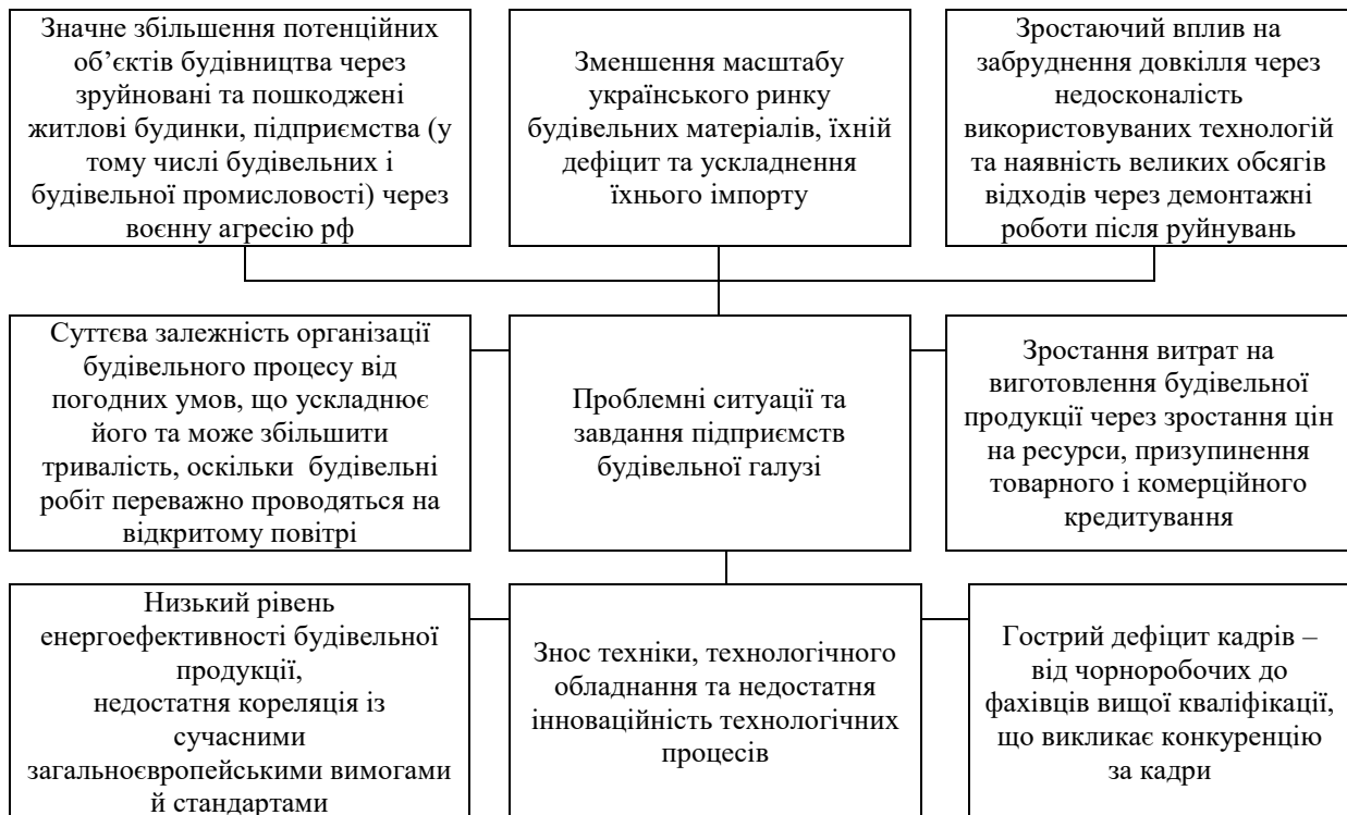
Рис. 4. Проблемні ситуації та завдання будівельних підприємств, що виникли під впливом глобальних та локальних викликів

можливість перервати ланцюг «глобальний виклик → проблеми та завдання, що виникають → їхнє перетворення на загрози діяльності → формування загрози → реалізація загрози → наслідки реалізації загрози».