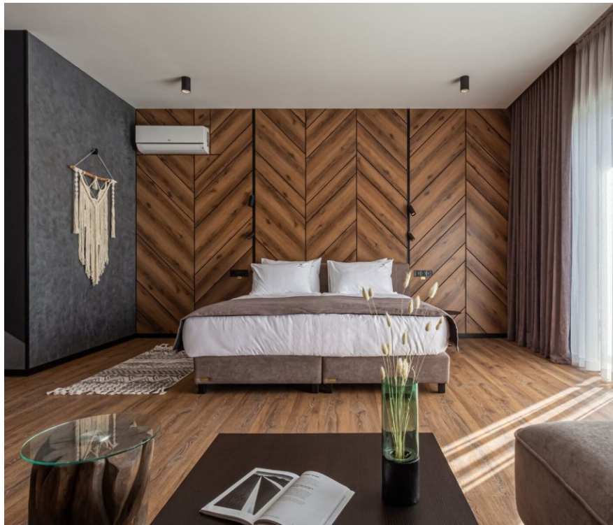
Рис.1. Didukh eco-hotel and spa

Прикладом екологічно чистого будівництва можуть слугувати об'єкти готельної групи Ribas Hotel Group, яка використовує принципи еко-дизайну в сфері будівництва готелів (рис.1).