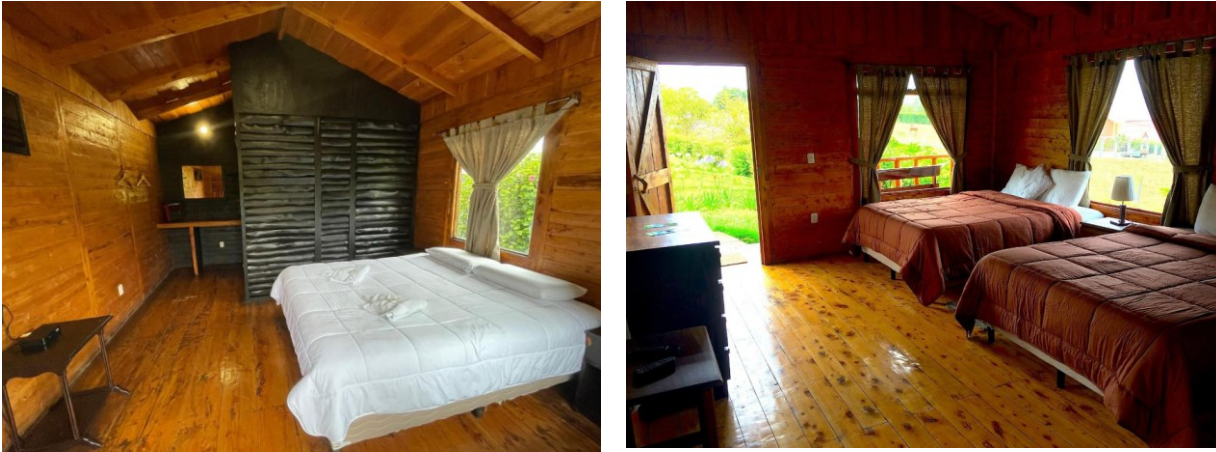
Рис.2. Grandpa's Hotel

Основними стимулами для впровадження екологічної відповідальності є фінансові вигоди, конкурентні переваги, покращення репутації, залучення нових клієнтів, підвищення організаційної спроможності та урядові гранти.