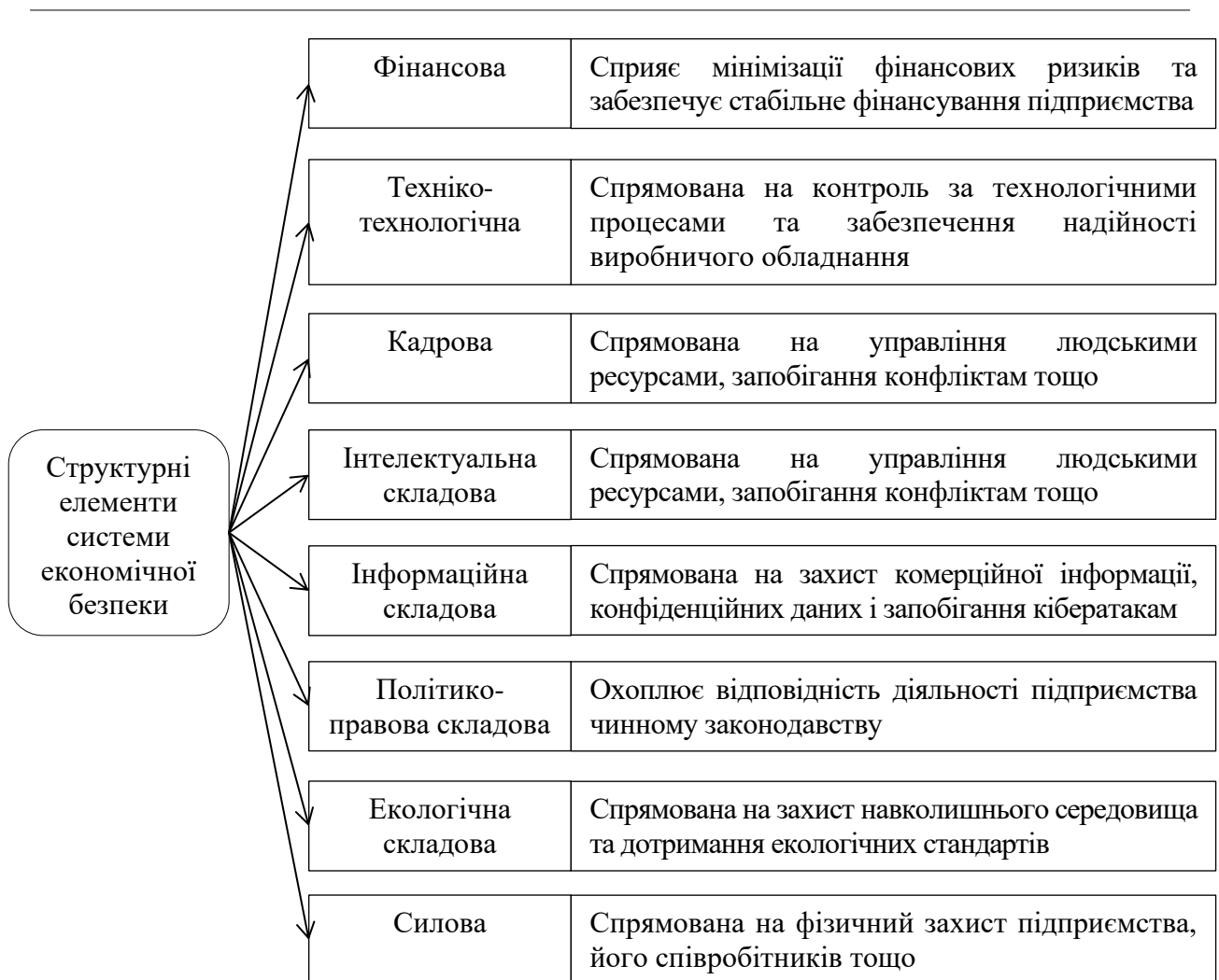
Рис. 1. Складові системи економічної безпеки підприємства

Кадрове забезпечення відіграє ключову роль у системі економічної безпеки підприємства, адже людський капітал є найважливішим ресурсом, який сприяє збереженню стабільності всіх складових економічної безпеки, а також є джерелом ризиків для суб'єктів господарювання. Кадрове забезпечення – це процес управління персоналом на підприємстві, який включає планування, підбір, навчання, розвиток, мотивацію та контроль за кадрами для досягнення стратегічних цілей підприємства.