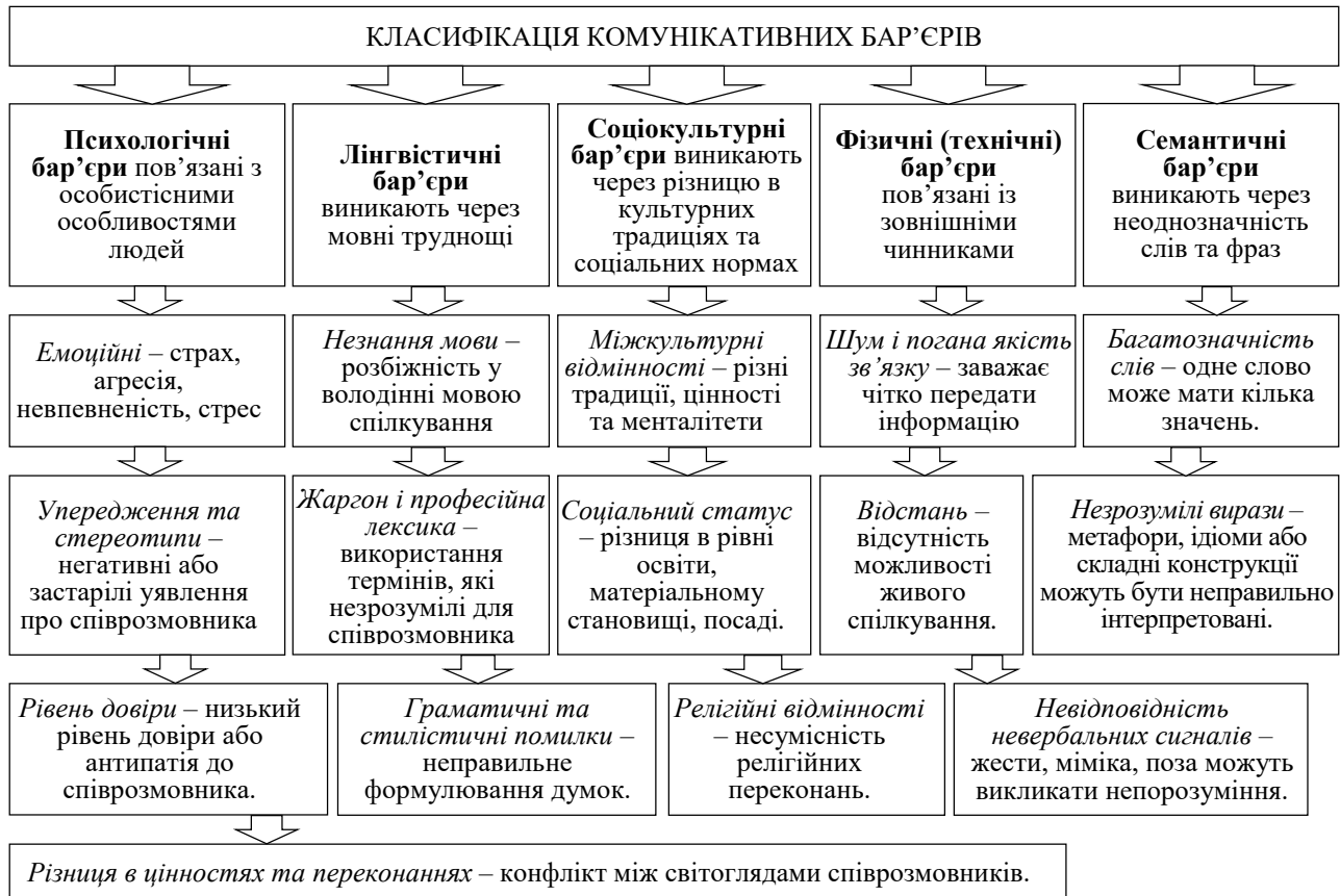
Рис. 2. Класифікація комунікативних бар'єрів

Комунікативні бар'єри (франц. barriere – перешкода) – це перешкоди на шляху адекватної передачі інформації між партнерами зі спілкування [2]. Розглянемо класифікацію комунікативних бар'єрів (рис. 2).