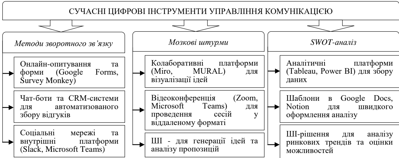
Рис. 3. Сучасні цифрові інструменти управління комунікацією

Варто зазначити, що сучасні технології відіграють важливу роль у комунікативному менеджменті, допомагаючи організаціям підвищувати ефективність внутрішніх і зовнішніх комунікацій. Завдяки цифровим інструментам компанії можуть швидко збирати та аналізувати інформацію, удосконалювати процеси прийняття рішень і підвищувати залученість співробітників (рис. 3).