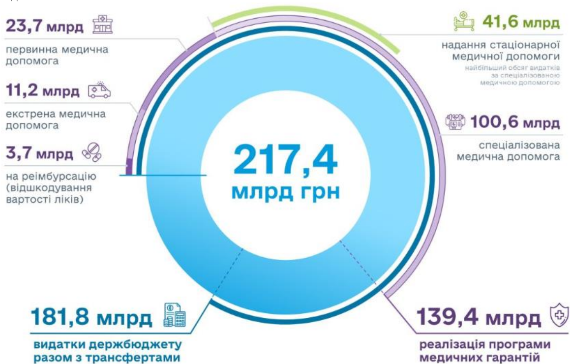
Рис. 2. Видатки на охорону здоров'я в Україні у 2023 р. [8]

Розподіл коштів демонструє прагнення України забезпечити громадянам доступ до основних медичних послуг, збільшити фінансування екстреної та спеціалізованої допомоги, підтримку програм, що дають доступ до медикаментів.