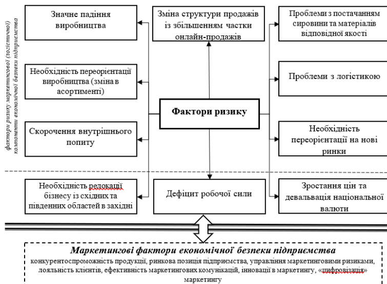
Рис. 1. Фактори ризику для підприємств легкої промисловості з початком військової агресії рф

З інформації рис. 1 можна зробити висновок, що з десяти перерахованих факторів ризику сім стосуються питань маркетингової компоненти економічної безпеки підприємства. За таких умов, актуалізується питання необхідності розроблення відповідного механізму забезпечення економічної безпеки підприємств легкої промисловості на основі використання маркетингових інструментів, метою якого є забезпечення стабільності та стійкості їх економічної системи, зміцнення конкурентних позицій на ринку та високого рівня адаптивності до мінливих ринкових умов за сучасних економічних ризиків і загроз. Як зазначає Лисиця Н., маркетингова стратегія відіграє важливу роль в забезпеченні економічної безпеки та успіху сучасних підприємств в умовах висококонкурентного середовища [4].