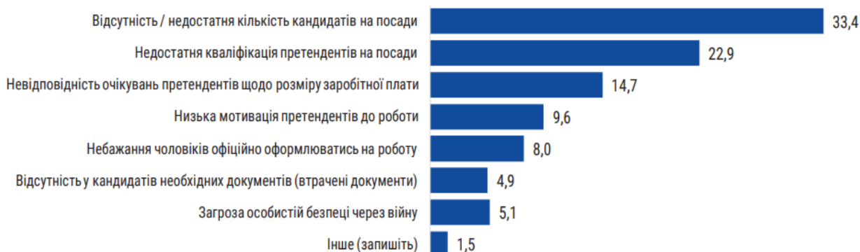
Рис. 2. Оцінка труднощів набору працівників, %

Аналізуючи ринок праці, доцільним буде виокремлення і проблемних моментів в цьому питанні. Варто зауважити, що 10% роботодавців зазначили низький рівень мотивації кандидатів до роботи. Це вказує на те, що загалом роботодавці змушені докладати більше зусиль для пошуку працівників, ніж самі кандидати для працевлаштування. Крім того, 8% роботодавців звернули увагу на небажання чоловіків офіційно оформлюватися на роботу. Експертні оцінки в межах 12 ключових секторів економіки підтвердили низьку мотивацію до роботи серед внутрішньо переміщених осіб, зокрема чоловіків (рис. 2) [6, 9].