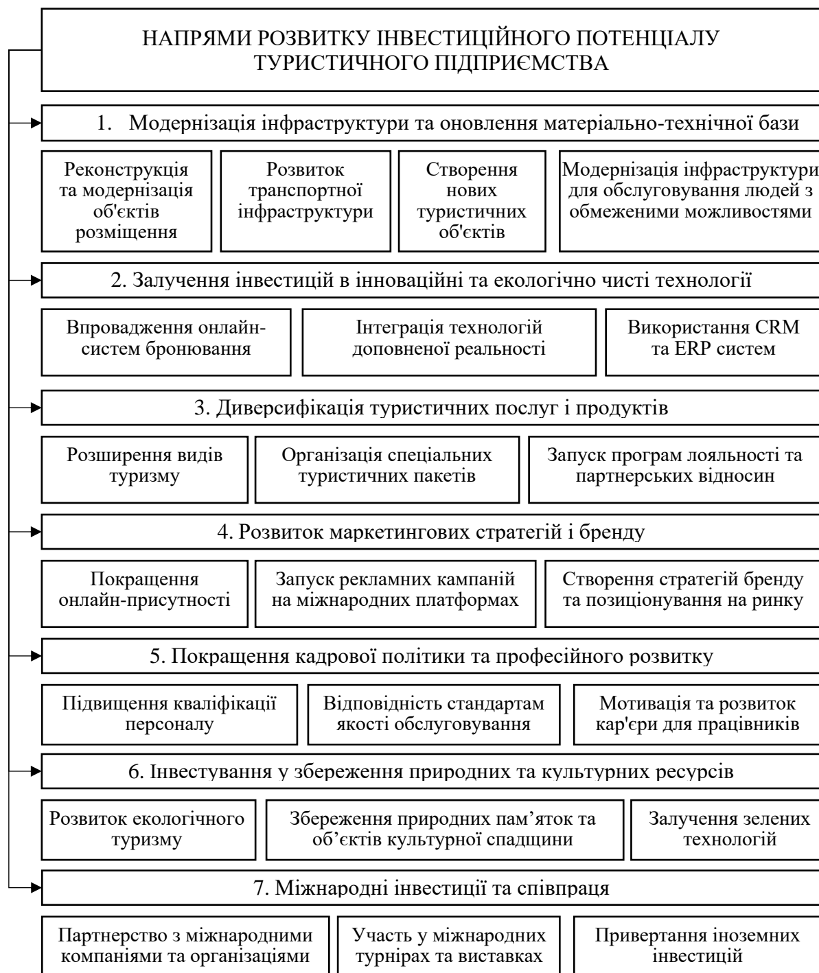
Рис. 2. Ключові напрями розвитку інвестиційного потенціалу туристичного підприємства

туристичним підприємствам розширювати свою діяльність на міжнародних ринках. Це допомагає розвивати нові ринки, диверсифікувати ризики і підвищувати фінансову стабільність.