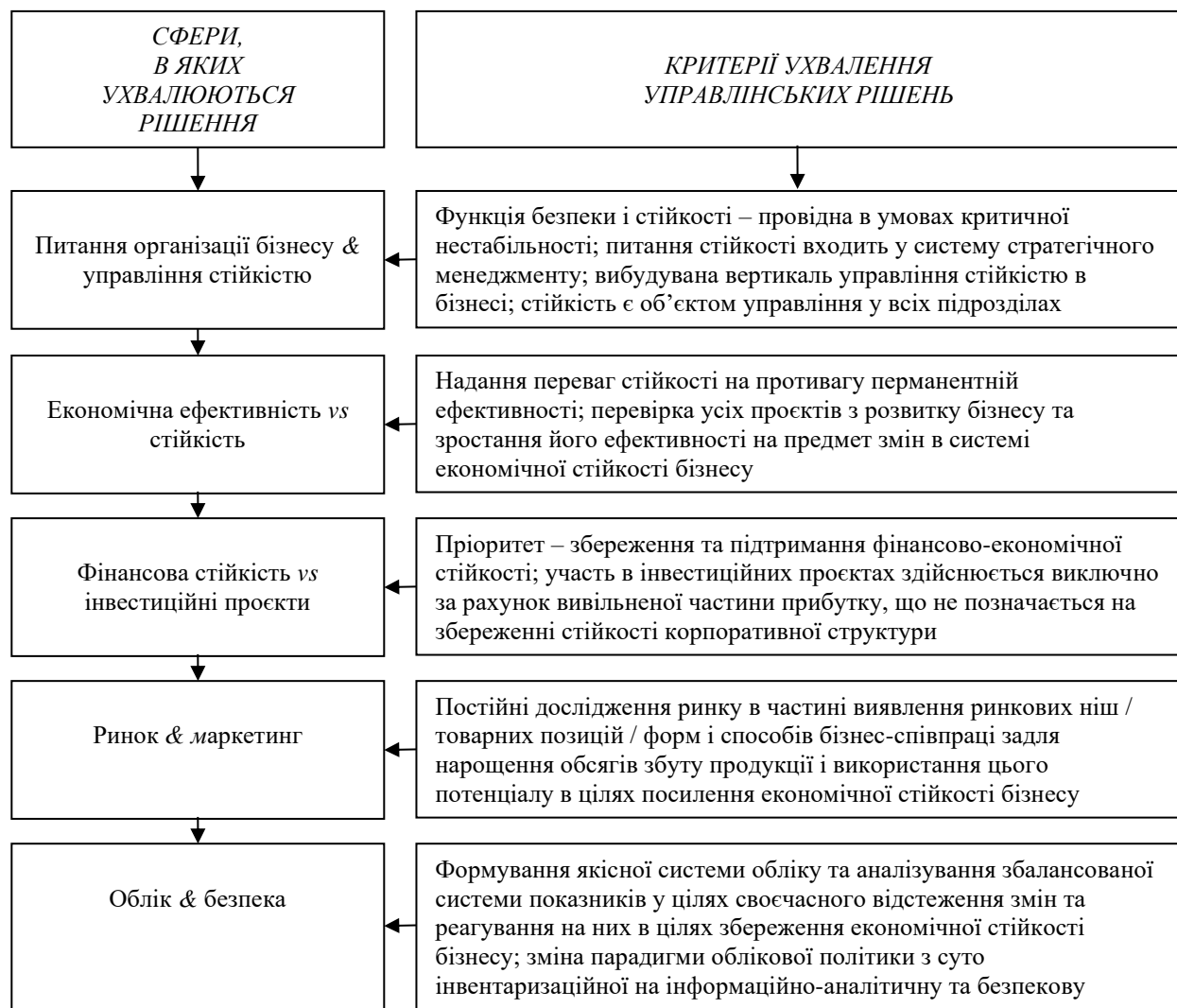
Рис. 1. Провідні принципи в сфері менеджменту економічної стійкості суб'єктів господарювання в умовах кризи

Вважаємо, що розуміння зазначених критеріїв менеджменту дозволяє ухвалювати справді вірні рішення в сфері економічної стійкості підприємства.