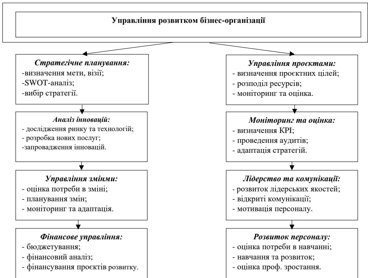
Рис. 1. Ключові аспекти управління розвитком бізнес-організації